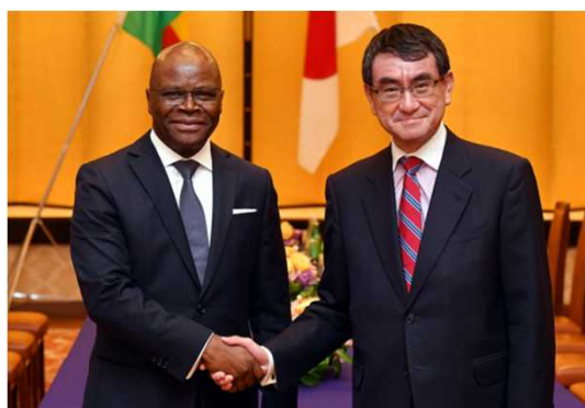
<Réunion ministérielle des Affaires étrangères entre le Japon et le Bénin, le 20 juin 2018, TOKYO>

Des échanges fréquents de haut niveau entre les deux pays illustrent également les bonnes relations bilatérales. En effet, au cours de l'année 2018, une délégation de trois sénateurs du Japon a visité le Bénin et S.E.M. Aurélien AGBENONCI, Ministre des Affaires étrangères et de la Coopération ainsi que S.E.M. Romuald WADAGNI, Ministre de l'Économie et des Finances se sont rendus au Japon. Les deux Ministres ont rencontré respectivement avec leurs homologues japonais.