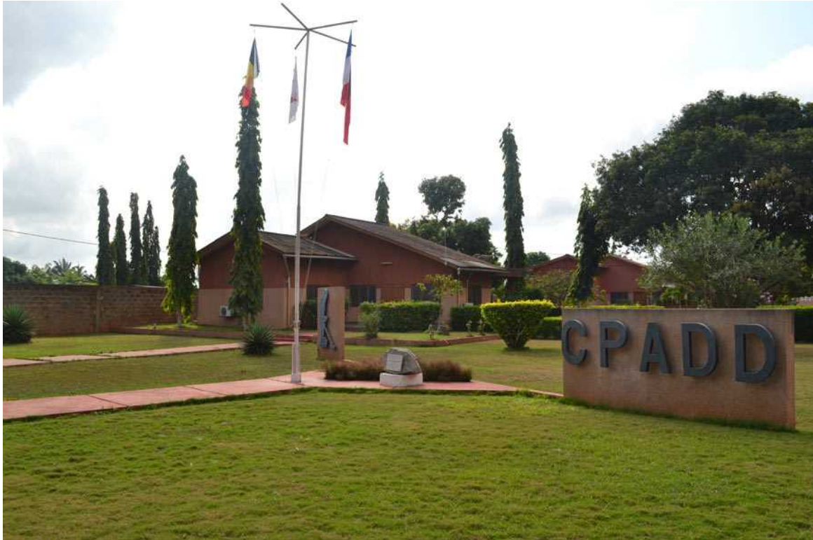
<CPADD à Ouidah>