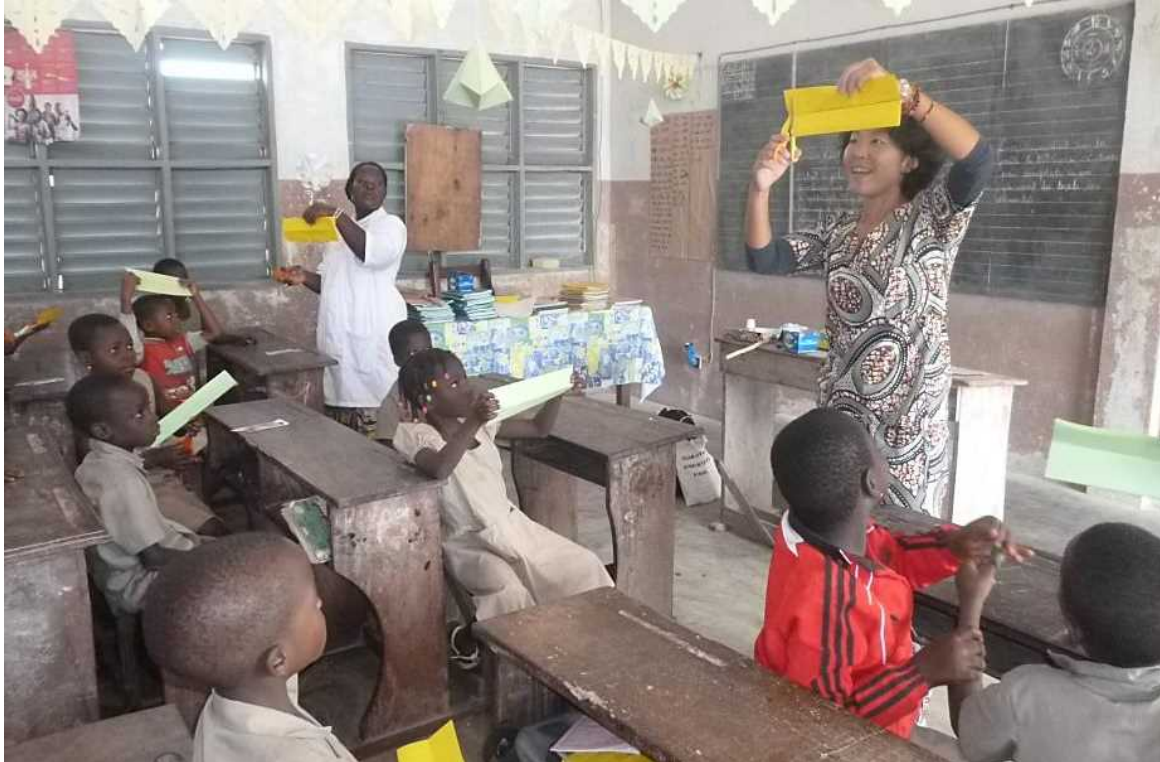
<Une volontaire japonaise en séance avec les élèves>

L'Agence Japonaise de Coopération Internationale (JICA), est active dans plus de 150 pays et régions et est chargée de la mise en œuvre de l'Aide Publique au Développement (APD) du Japon. Selon sa vision de « Guider le monde en tissant des liens de confiance », la JICA contribue à résoudre les problèmes des pays en voie du développement, en utilisant les outils les plus appropriés de diverses méthodes d'aide et une approche combinée par région, par pays et par problème.