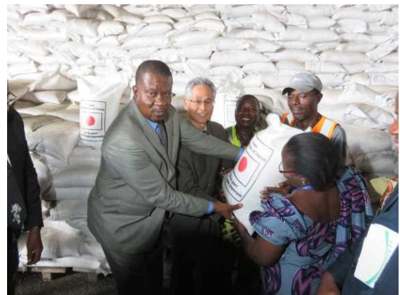
<Remise de don du KR 2016>

Avec l'utilisation des fonds de contrepartie, constitués à partir de la vente de riz octroyé par le Japon (KR) et des dons hors projets, le Gouvernement du Bénin peut réaliser des projets pour son développement socio-économique. Ce dernier exécute le « Projet Commune du Millénaire de Bonou pour un Développement Durable » pour un coût total de 3 milliards de FCFA. Ces fonds sont aussi utilisés pour la seconde phase du projet de Banikoara pour un montant de 750 millions de FCFA. Ces projets visent la mise en place des mécanismes nécessaires de la réduction de la pauvreté. Enfin, le projet « Initiative africaine d'éducation à la paix et au développement par le dialogue interreligieux et interculturel » exécuté avec ces fonds pour un coût total de 200 millions de FCFA.