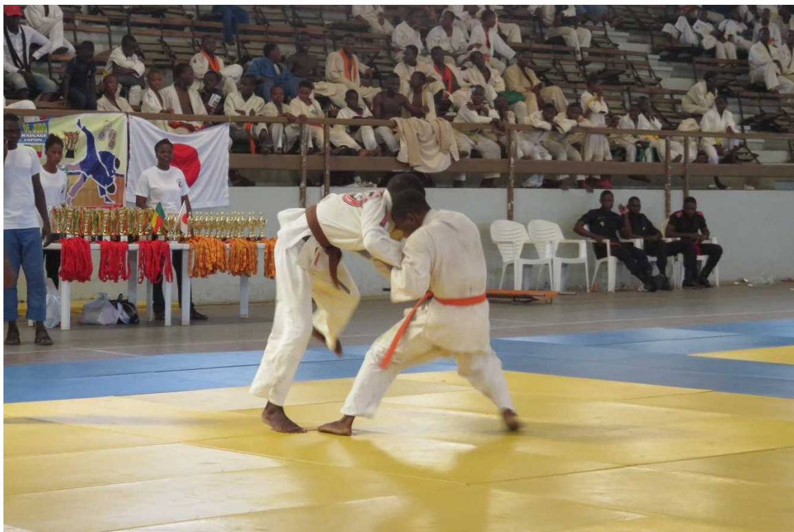
<La Coupe de Judo de l'Ambassadeur du Japon au des arts>