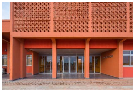
<Vestibule de l' montrant l'Hôpital d'Allada>

Ce projet d'un coût global d'environ 10 milliards de FCFA et dont les travaux ont été officiellement lancés le 16 août 2016 pour s'achever vers la fin de juillet 2018, vise à doter le Bénin d'un nouvel hôpital de référence à Allada. La réalisation du projet contribuera au renforcement du système sanitaire et surtout à l'amélioration des services médicaux et sanitaires des populations d'Allada et des communes voisines telles que Zè, Toffo et Tori-Bossito. La cérémonie d'ouverture de l'hôpital est prévue pour le 21 août 2018