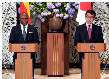
<Les deux ministres ont animé la conférence conjointe de presse>

Pendant son séjour, la rencontre entre ces deux ministres a eu lieu à Tokyo. La séance ministérielle s'est déjà tenue à Maputo, Mozambique, en marge de la réunion ministérielle de la TICAD en 2017. Les deux ministres ont abordé plusieurs sujets tels que la coopération nippo-béninoise, les dossiers internationaux comme la Corée du Nord, la sécurité maritime, etc. A la suite de la rencontre, la conférence conjointe de presse a été organisée et les deux ministres ont convenu de renforcer davantage les liens d'amitié et de coopération entre nos deux pays. Le ministre M. KONO a également remercié le précieux soutien apporté par le Bénin pour l'Exposition Universelle 2025 à Osaka.