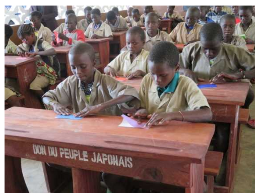
<Séance d'origami à Kandi>

C'est un art traditionnel du tracé de lignes au pinceau, connu sous le nom de Shodō. Une séance d'introduction à cet art japonais est souvent animée par une équipe de l'Ambassade du Japon. En plus, plusieurs écoles primaires au Bénin ont été initiées à la pratique de l'origami qui est un art traditionnel japonais du pliage de papier.