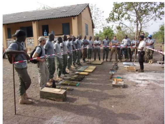
<Séance de la formation de l'opération du déminage>

Le CPADD a été créé au profit des pays touchés par la problématique des mines et engins explosifs et propose de formations répondant aux besoins des opérations de maintien de la paix et des programmes de déminage humanitaire engagés sur le continent africain. Le Japon est un partenaire financier du CPADD depuis 2009 où 2 millions US dollars ont été accordés au centre et a permis d'accueillir 48 stagiaires, d'acquérir 4 véhicules neufs, et des matériels de bureaux. Un appui de 500 mille US dollars a été accordé au centre en 2013 et a servi à la construction d'un bâtiment et acquisition du matériel de bureaux. Un nouveau financement de 1 million US dollars accordé au centre, visant essentiellement le renforcement des capacités humaines, techniques et matérielles du CPADD.