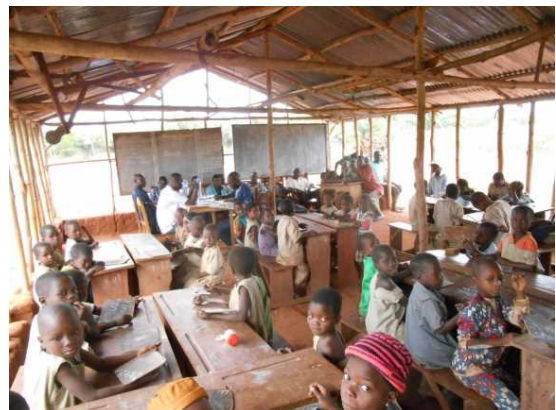
<Ce projet contribuera à l'amélioration des infrastructures scolaires>

La signature de l'Echange de Notes du projet a été faite en décembre 2017 pour un montant d'environ 7 milliards 285 millions de FCFA pour la construction de 202 salles de classe dans 34 écoles et de 8 salles de classe dans 2 écoles maternelles. Ce projet en cours de réalisation, permettra d'assurer les conditions optimales d'apprentissage aux élèves, de même qu'accroître le goût du travail aux enseignants. Le Japon a contribué jusqu'aujourd'hui à la réalisation de plus de 1.400 salles de classes au Bénin.