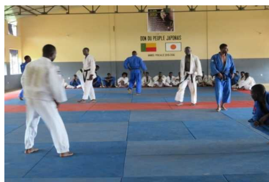
<Un gymnase moderne de judo et les Judokas>

APL Culturel permet de financer les projets pouvant contribuer à la préservation du patrimoine culturel, à la promotion de la culture et l'enseignement supérieur. Ce programme a pour but d'encourager l'échange culturel entre le Japon et les pays en voie du développement. Nous avons réalisé deux projets d'APL Culturel en 2015; Le Projet d'extension de salles de classes à l'école d'apprentissage de la langue japonaise 'TAKESHI NIHONGO GAKKOU' et le Projet de construction d'un gymnase judo à l'INJEPS.