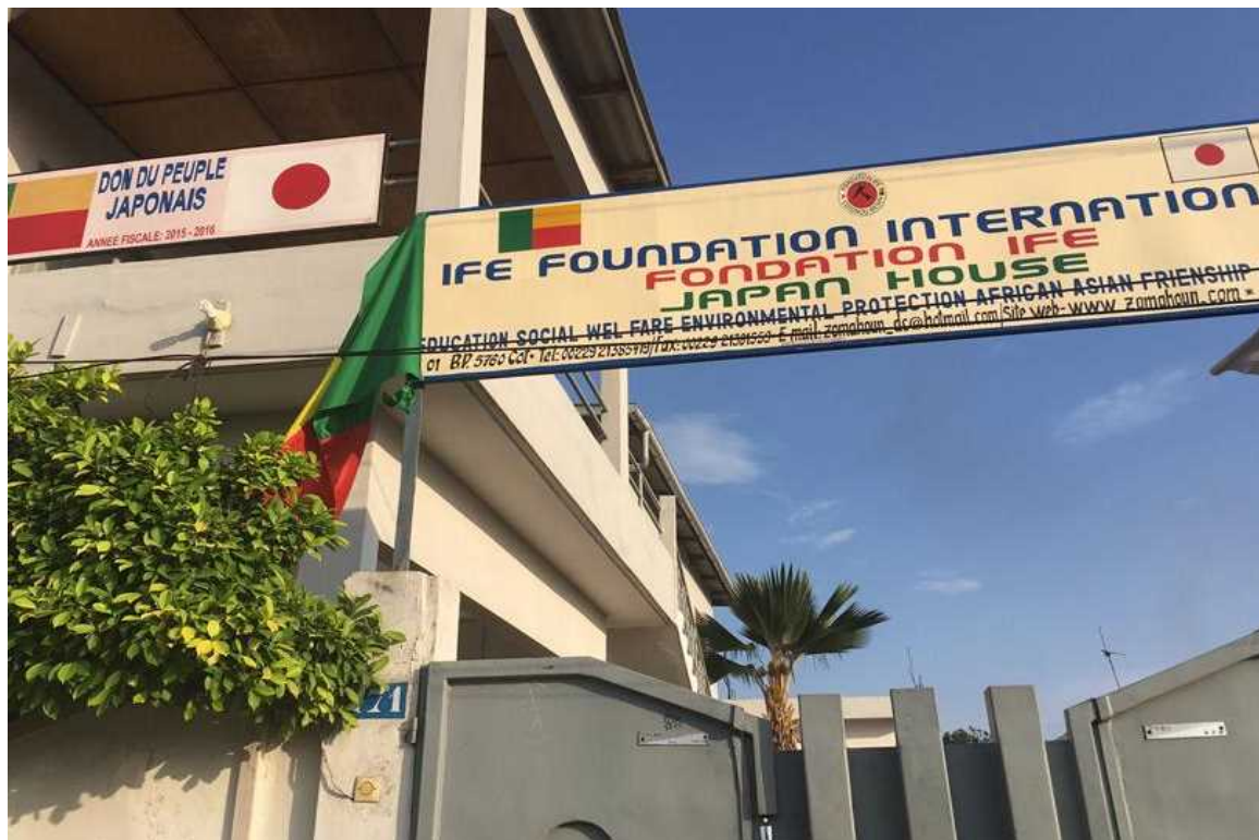
<Ecole d'apprentissage de la langue japonaise 'TAKESHI NIHONGO GAKKOU'>