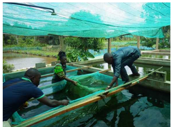
<Formation des acteurs aux techniques des élevages>

Le PROVAC vise à intensifier la production piscicole au Bénin à travers l'approche innovante de vulgarisation « fermier à fermier » et l'amélioration des techniques de pisciculture. Le PROVAC a vu le jour en juin 2010 et s'est achevé en novembre 2014 avec des résultats satisfaisants, car de 880 pisciculteurs au début du projet, le PROVAC a formé environ 2.200 béninois(es) en pisciculture continentale. Ces résultats satisfaisants ont conduit au PROVAC 2 qui a démarré en mars 2017 et vise la préservation des acquis du PROVAC 1 avec un accent particulier sur une production quantitative de poissons. Il envisage également le transfert de technologies aux pays voisins comme le Togo, le Cameroun, le Gabon, le Congo, la RDC et l'Angola.