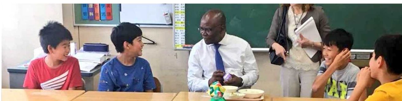
<Visite de Ministre AGBENONCI à l'école primaire de Kasama. Déjeuner d'un repas de cantine scolaire avec les élèves>