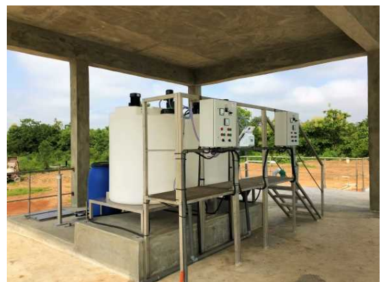
<Équipement d'eau potable>

La signature de l'Echange de Notes du projet a été faite en mars 2016 pour un financement qui s'élève à plus de 5 milliards 350 millions de FCFA. Le Japon est heureux d'accompagner les efforts du Gouvernement béninois afin que l'eau potable ne soit plus une denrée rare dans des communes à situation géologique, caractérisée par des roches telles que Glazoué et Dassa-Zoumé. Ainsi, ce projet dont les travaux à la charge du Japon se sont déjà achevés à la fin de juillet et qui consiste à l'exploitation des eaux souterraines à travers la technologie de pointe japonaise, permettra de soulager les peines des populations cibles.