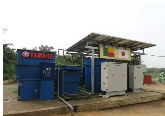
<Projet d'amélioration de l'accès à l'eau potable des villages de Avinouhoué dans la Commune de Lokossa>

Les principaux domaines couverts par ce programme sont l'éducation, la santé, l'approvisionnement en eau potable, toutes les actions relatives à la réduction de la pauvreté. Jusqu'à présent, nous avons exécuté 52 projets depuis 2003, le montant total de tous les projets est environ 2 milliard de FCFA