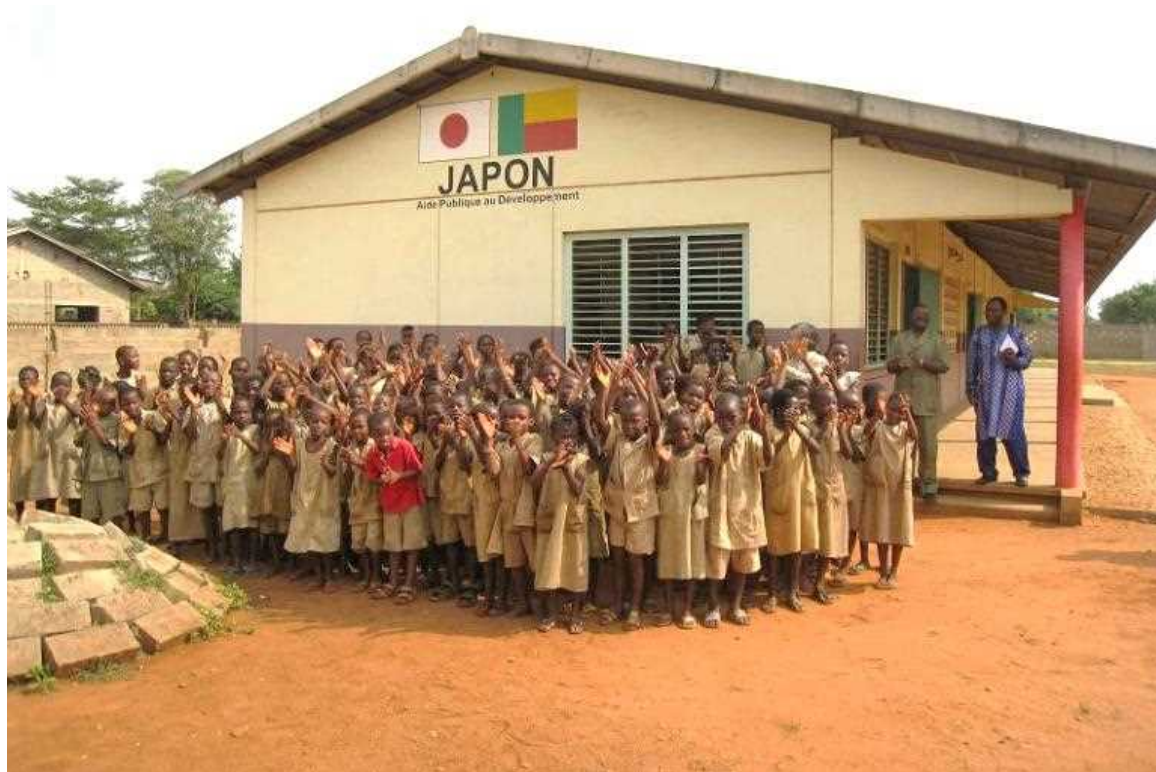
<Elèves posent devant un joyeux , fruit de la coopération Benino-japonaise>

La Signature du protocole d'accord entre le Bénin et le Japon en 2003, le programme JOCV au Bénin a démarré en mars 2005. Le Bureau de Cotonou est devenu JICA BENIN en avril 2007. Durant 15 ans, les activités de la JICA se sont étendues dans des secteurs tels: Education, Santé, Eau, Agriculture, Pêche, Pisciculture et Infrastructure.