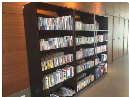
<Mini-bibliothèque à l'Ambassade du Japon>

Le jour d'accès est chaque mercredi de 15h-18h. La bibliothèque est composée de manuels de la langue japonaise, de romans japonais en français et en japonais, et de mangas (bandes dessinées japonaises en français et en japonais). Un espace de lecture et d'étude y est aménagé à cet effet.