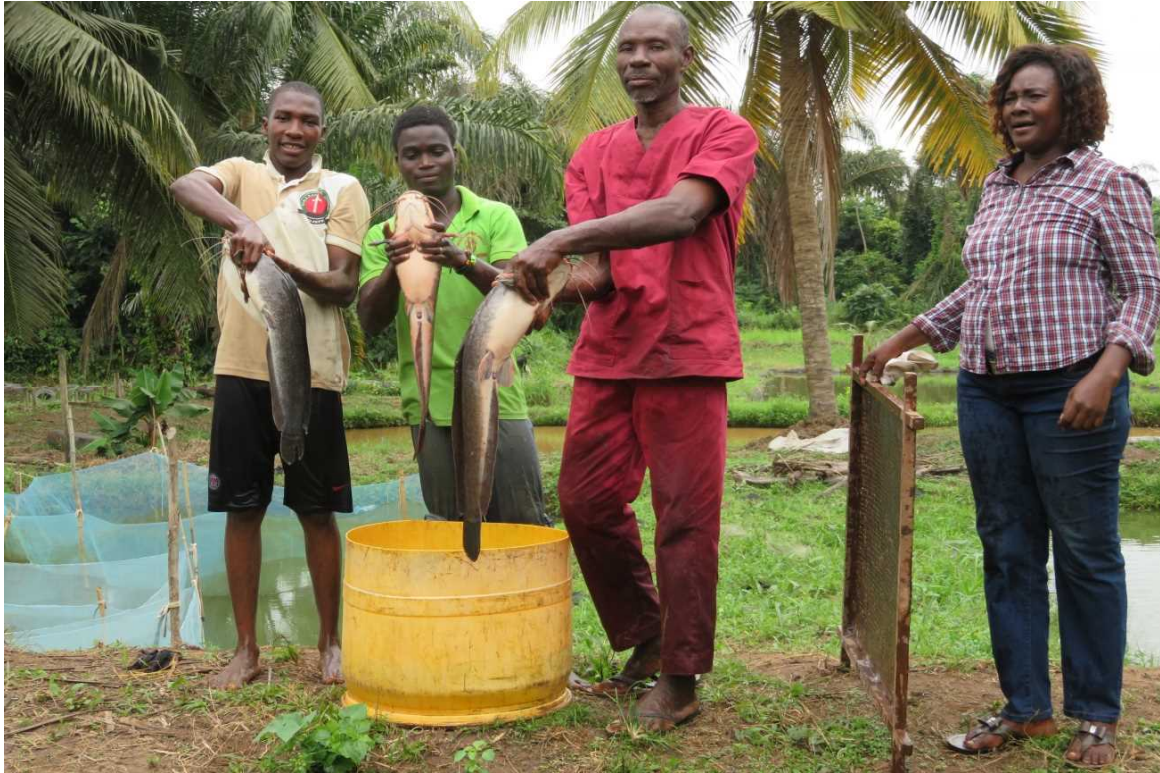
<Bénéficiaires du PROVAC>