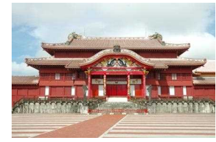
(Château de Shuri)