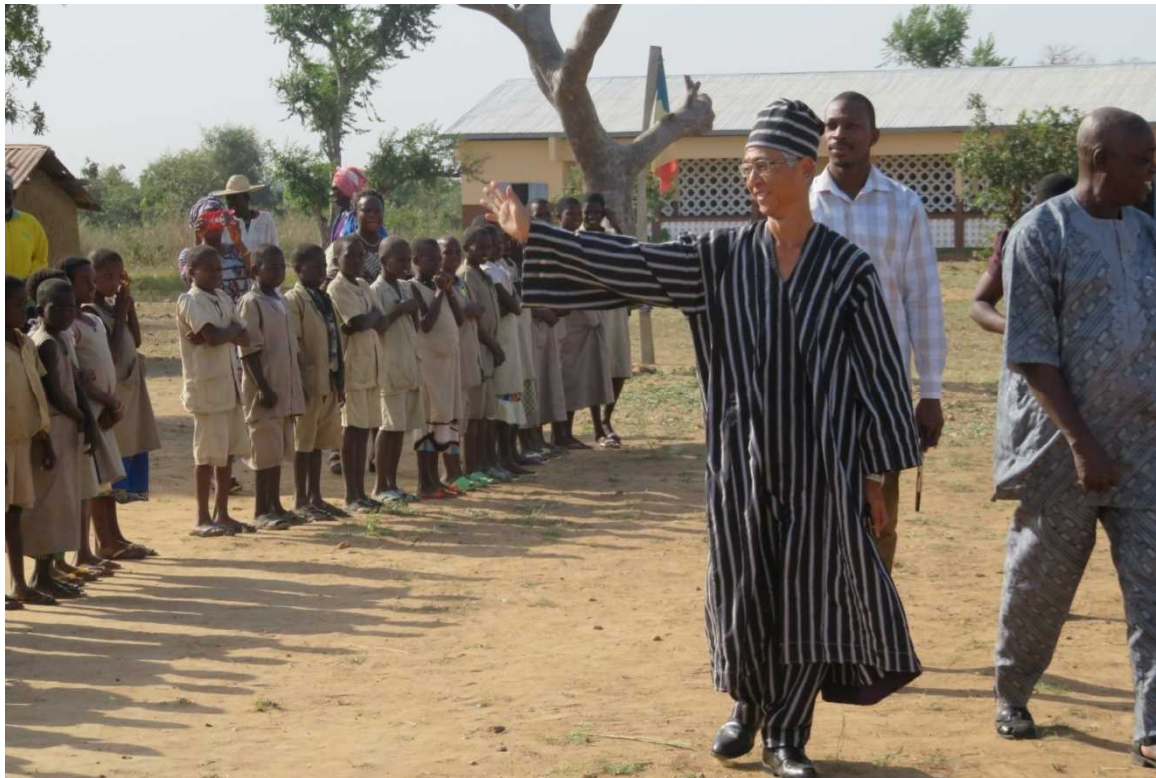
<Inauguration du module de salle de classes à Kandi par M. Kiyofumi KONISHI, Ambassadeur du Japon>