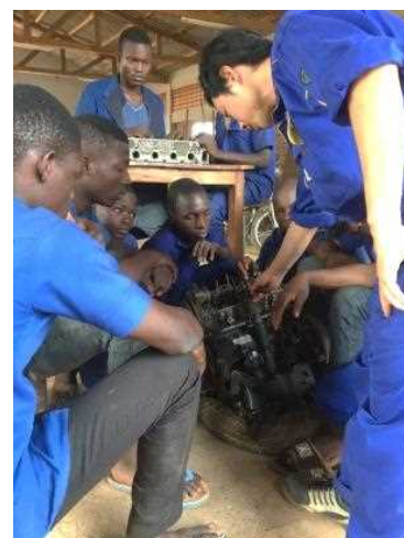
<Transfert de connaissance technique au profit d'un groupe béninois >