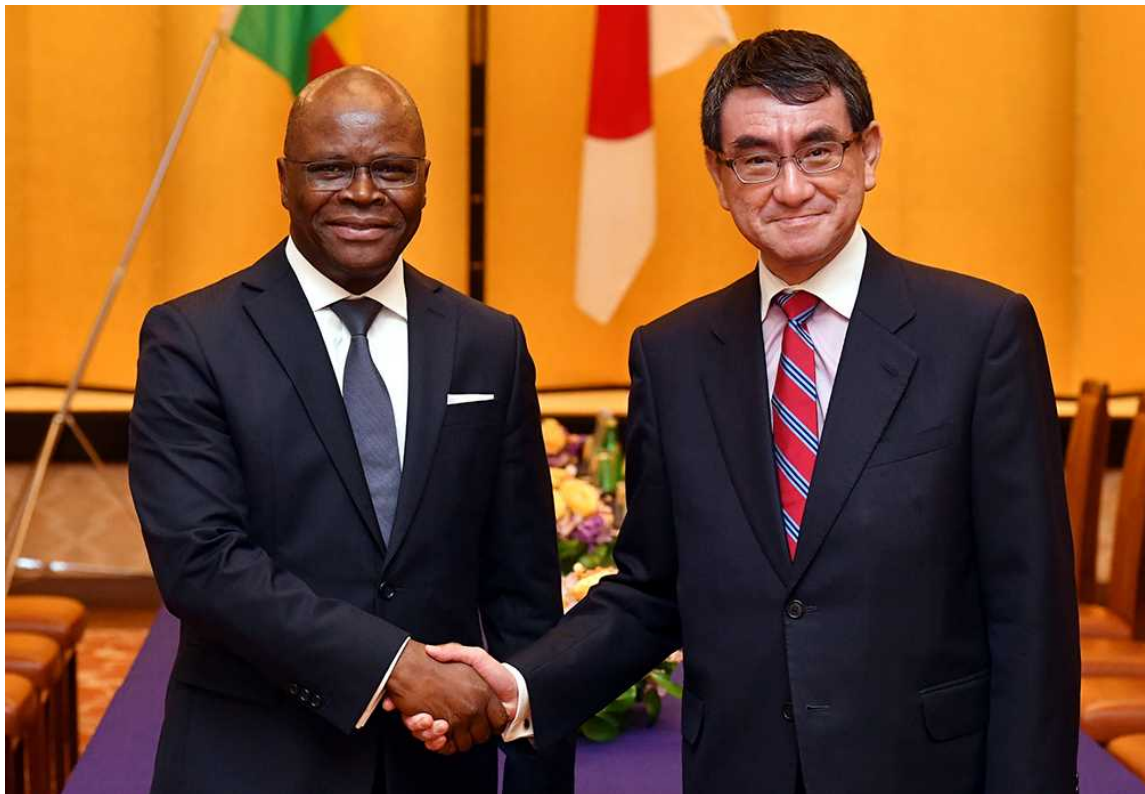
<Réunion ministérielle des Affaires étrangères entre le Japon et le Bénin, le 20 juin 2018, TOKYO>

Le ministre des Affaires étrangères et de la Coopération, Aurélien AGBENONCI, s'est rendu au Japon du 18 au 22 juin 2018, à l'invitation de son homologue japonais, M. Taro KONO. C'est la première fois depuis 5 ans que un Ministre des Affaires étrangères du Bénin se rend officiellement au pays du Soleil levant.