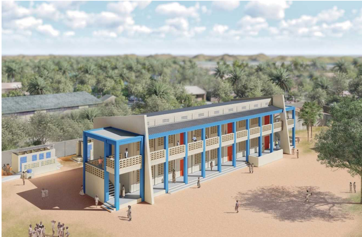
<Image de 202 salles de classe dans 34 écoles à construire sur financement du Japon>