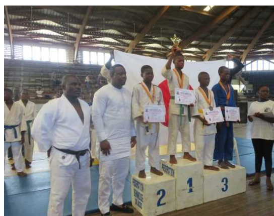
<Remise des médailles>

Il y a environ 2.000 judokas au Bénin, quatrième édition et co-organisée avec le Comité Exécutif de la Fédération Béninoise de Judo. Environ 400 Judokas ont participé cette année à la compétition. En plus des trophées et médailles, l'Ambassade du Japon a offert 50 judo-gi (tenues de Judo) à la Fédération. A travers l'organisation de cette compétition, l'Ambassade espère voir des judokas béninois participer aux Jeux olympiques et paralympiques de 2020 à Tokyo.