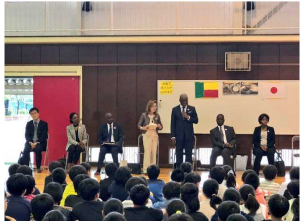
<Ministre AGBENONCI avec les élèves. Exécution du hymne national du Bénin en français par les élèves>

Après une série de rencontres avec les personnalités de Yokohama, le ministre a visité l'école primaire de Kasama à Yokohama dont les élèves continuent l'échange avec ceux de EPP Suru Léré à Cotonou. Le ministre lui-même a pris le déjeuner scolaire avec des élèves. Au Japon, la cantine scolaire est mise en place sur tout le territoire de l'archipel et les élèves eux-mêmes s'occupent de dresser le couvert, arranger un mets dans une assiette et débarrasser à la fin du déjeuner. Cela donne aux élèves une notion de responsabilité et de coopération. Par ailleurs, après les cours, tous les jours, les élèves font le ménage dans leur salle de classe.