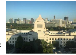
(Chambre du Parlement)