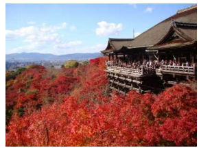
(Temple de Kiyomizu)