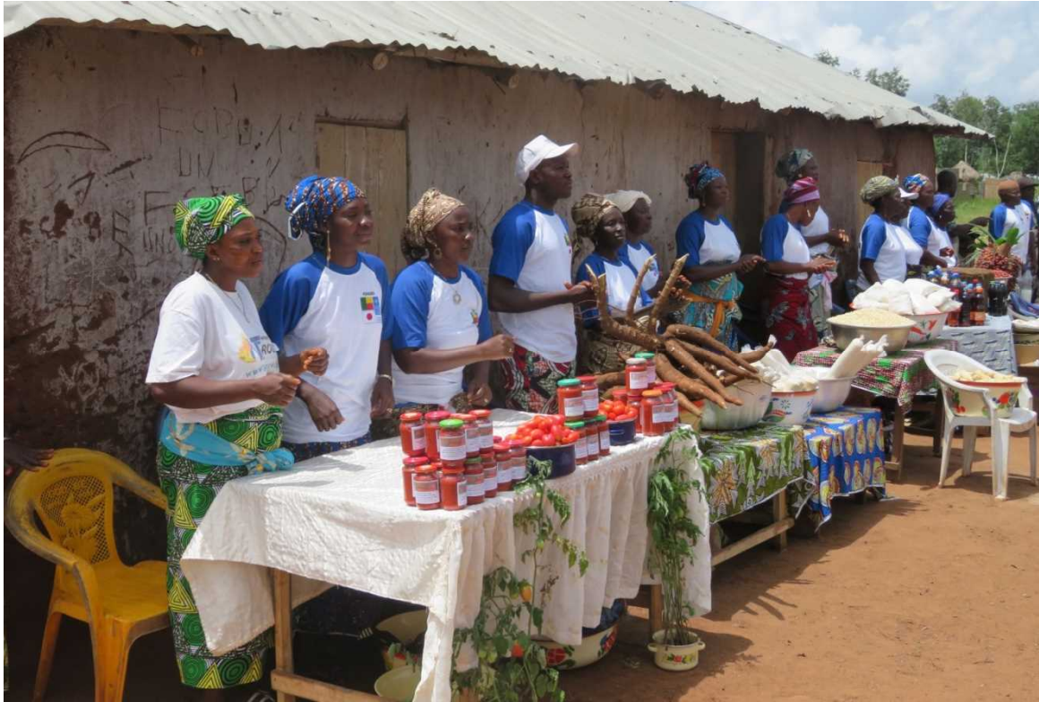
<Ce projet favorise les activités génératrices de revenu des femmes>